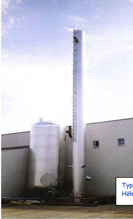
Typ: Pentamat-S5E-E-IIID Höhe: 16 m

Anlagenbeispiele zum Ausschreibungstext Nr.: 33 - 35 Kamintypen: Pentamat , S-5E-L, S-5E-A, S-5E-E Seiten: 28 - 29