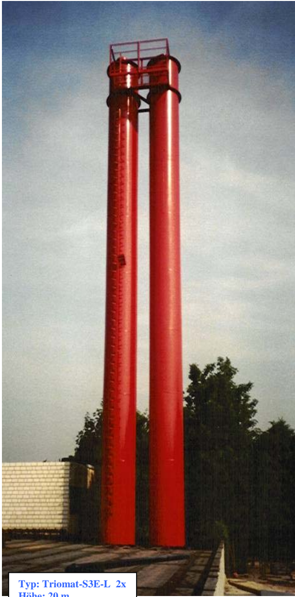
Typ: Triomat-S3E-L 2x Höhe: 20 m

Anlagenbeispiele zum Ausschreibungstext Nr.: 27 - 29 Kamintypen: Triomat , S-3E-L, S-3E-A, S-3E-E Seiten: 24 - 25