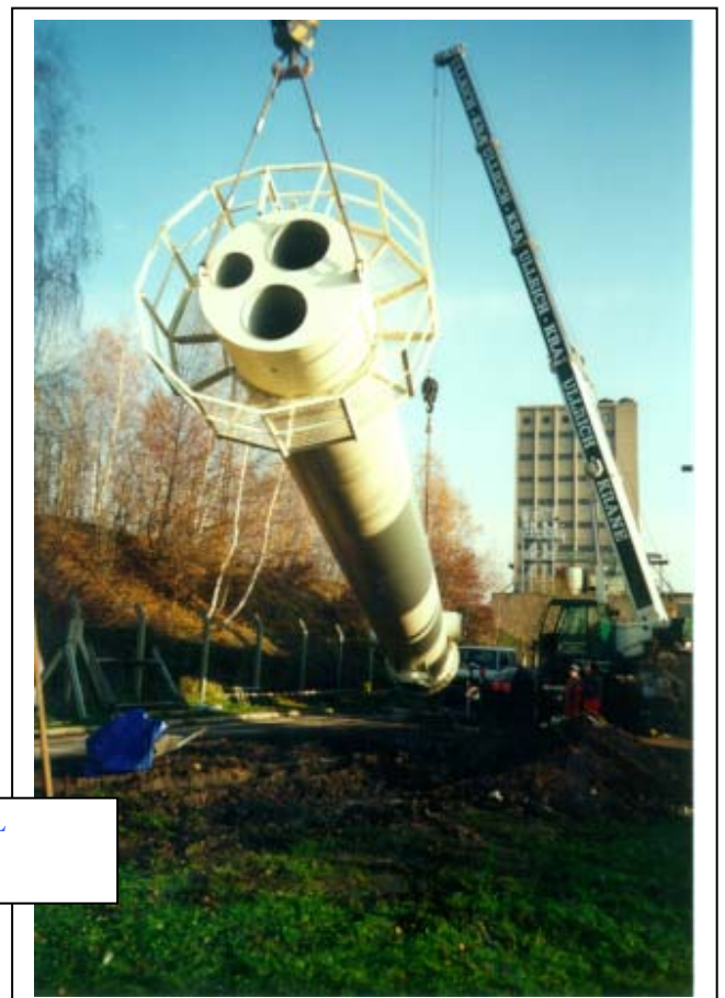
Typ: Triomat-S3E-L Höhe: 20 m