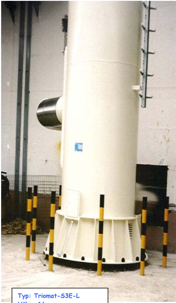
Typ: Triomat-S3E-L Höhe: 16 m mit Anfahrerschutz

Anlagenbeispiele zum Ausschreibungstext Nr.: 27 - 29 Kamintypen: Triomat , S-3E-L, S-3E-A, S-3E-E Seiten: 24 - 25